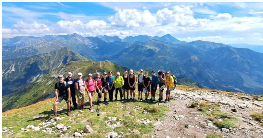
Foto 8. Kondracka Przelec

Ve 12:20 jsme byli na rozcestníku Kondracka Przelec 1725 m, což bylo 40 minut od vrcholu Giewont, na který jsme nakonec nešli, protože posledních 400 m pod vrcholem je zajištěná cesta po řetězech, na to jsme neměli potřebnou výbavu a byly tam velké fronty lidí. Dali jsme si svačinku, udělali několik fotek a vyrazili jsme k dalšímu rozcestníku Kopa Kondracka 2005 m, nejvyšší vrchol naší cesty. Pohledem do krajiny jsme viděli drobné, bílé cestičky vedoucí horskými masívy. Tam někde dole jsme byli před třemi hodinami, a teď tak vysoko. Jednou z těch cest jsme se po hřebeni vydali dále. Bylo vidět jak na slovenskou, tak i na polskou stranu Vysokých Tater, vše jako na dlani, a tak vysoko, při pohledu dolů ze srázu občas i mrazilo a lechtalo u žaludku, ale stálo to za to.