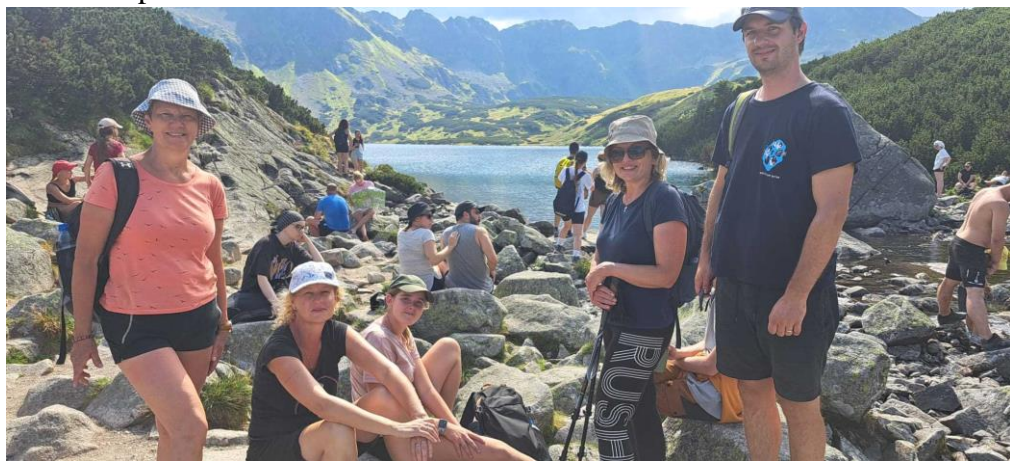
Foto 12. Osvěžení v Dolině pěti jezer

Ano, někteří si sáhli na dno svých sil, ale odměna v podobě ochlazení nohou v Předním jezeru (Przedni Staw) byla k nezaplacení. Odvážní si i zaplavali.