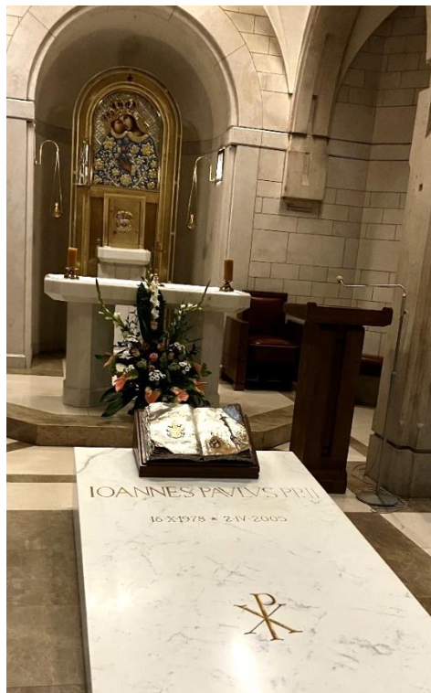
Foto 6. Náhrobní deska