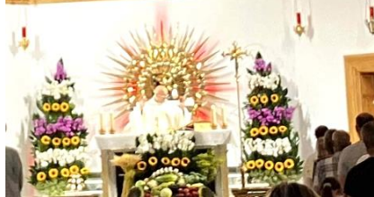
Foto 15. Interiér kostela a sousoší před kostelem