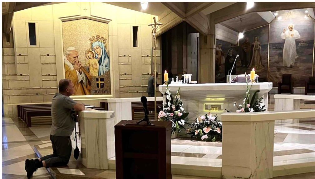
Foto 4. Centrální oltář ve Svatyni sv. Jana Pavla II.