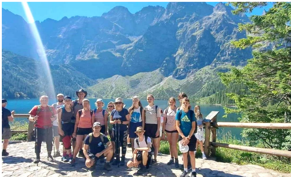
Foto 9. Rybí potok po Mořským okem

Poslední parkoviště v Národním parku, kam ještě mohl autobus zajet, bylo více než hodinu cesty od ubytování a již kolem osmé hodiny ranní se všechna parkoviště plnila auty, neskutečně velké davy lidí mířily po asfaltce k Mořskému oku. I my jsme po zakoupení vstupenky v 8:15 vyrazili, po dvou hodinách jsme byli u rozcestníku.