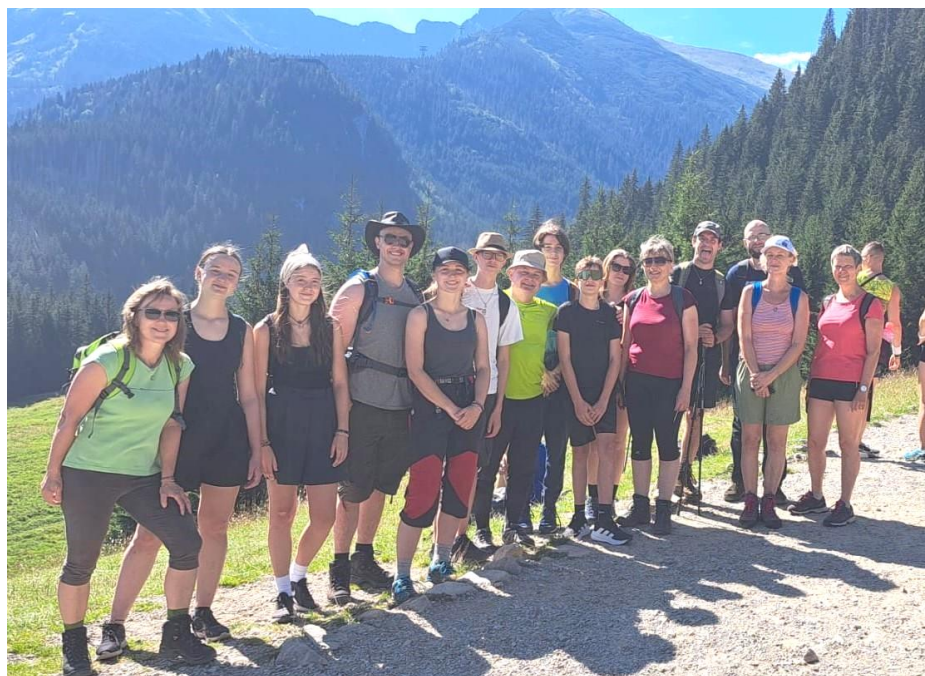
Foto 7. Hala Kondratowa