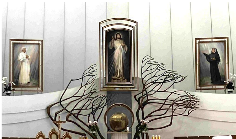
Foto 2. Oltář ve Svatyni Božího milosrdenství. Vlevo sv. Jan Pavel II. vpravo sv. Faustyna.

Poslání této prosté, ale statečné a pevně Bohu důvěřující sestry Faustyny spočívalo v těchto bodech: