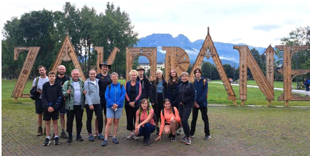
Foto 14. Farmářské trhy Zakopané

Na závěr dne jsme navštívili kostel Sanktuarium Matki Bozej Fatimskiej, kde probíhala mše svatá, byl totiž státní svátek Nanebevzetí Panny Marie. Většina kostelů, chrámů a kaplí v Polsku je zasvěcená Panně Marii nebo Janu Pavlu II., jsou neuvěřitelně krásně vyzdobené a udržované.