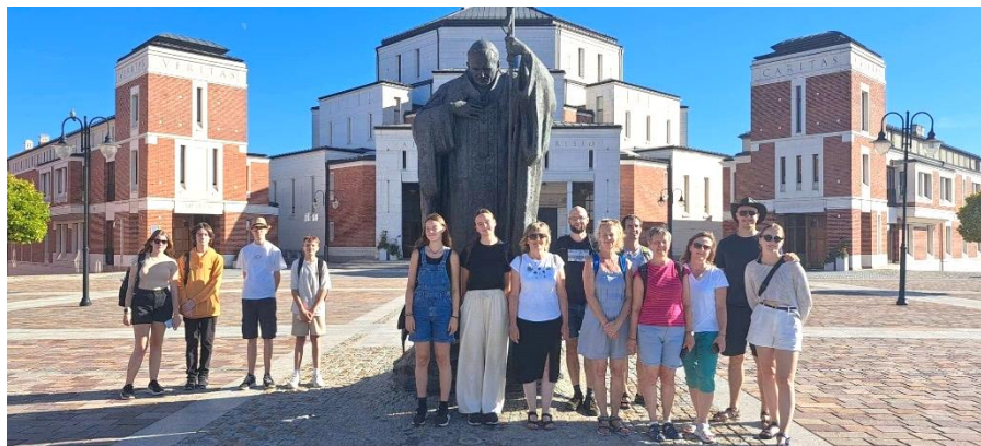
Foto 3. Socha sv. Jana Pavla II. před hlavním vstupem do svatyně

Do dalšího bodu našeho putování jsme šli parkem a kolem starého hřbitova, kde došlo k velkým znamením. Naším cílem byla Svatyně svatého Jana Pavla II.