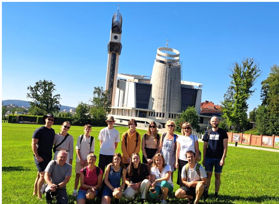
Foto 1. Svatyně Božího milosrdenství

Potom jsme navštívili Sanctuary of the Divine Mercy – Svatyni Božího milosrdenství , která je postavena ve tvaru lodě a uvnitř je oltář s obrazem milosrdného Ježíše a nápisem „Jezu, ufam tobie“, „Ježíši, důvěřuji Ti“, který pevně stojí nad celým světem uprostřed bouří, což zobrazují vlající větve u jeho nohou a kolem zlaté zeměkoule.