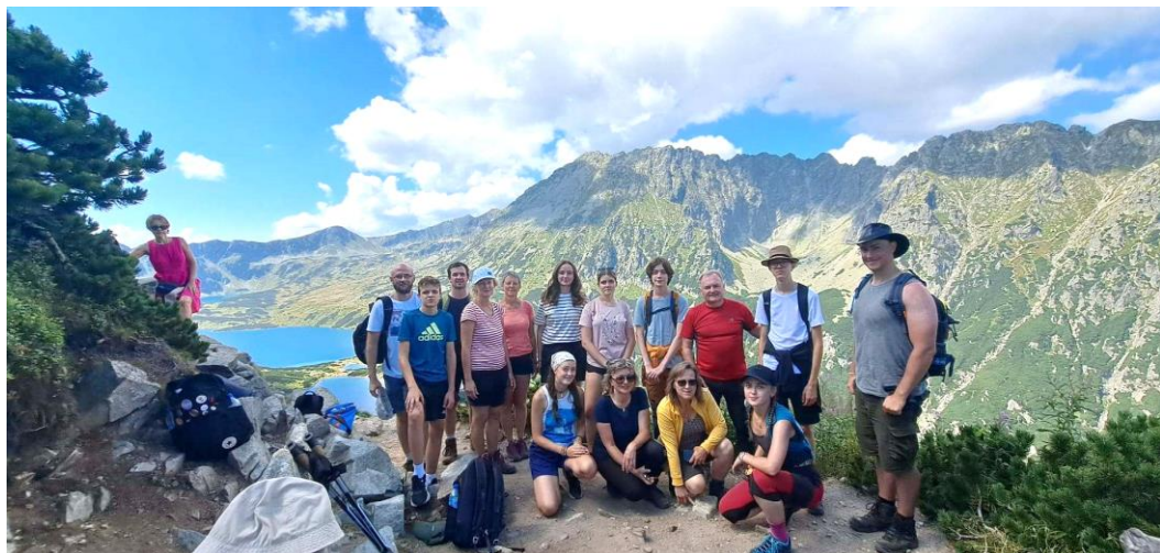
Foto 11. Dolina pěti jezer v pozadí

Ano, někteří si sáhli na dno svých sil, ale odměna v podobě ochlazení nohou v Předním jezeru (Przedni Staw) byla k nezaplacení. Odvážní si i zaplavali.