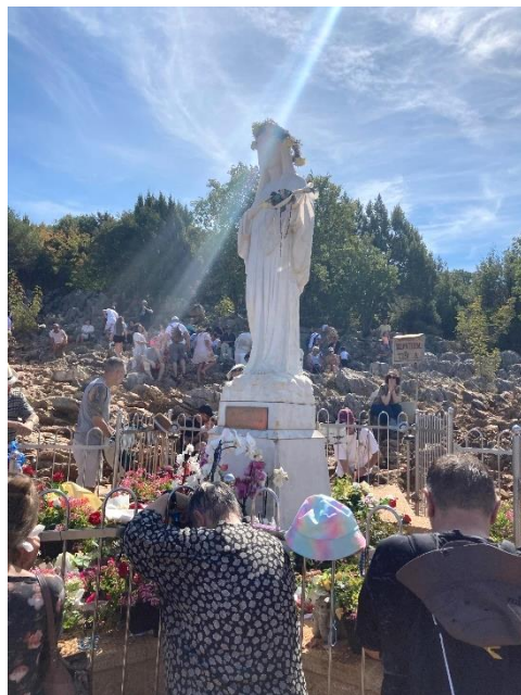
(Vrch zjevení – Podbrdo, srpen 2024)