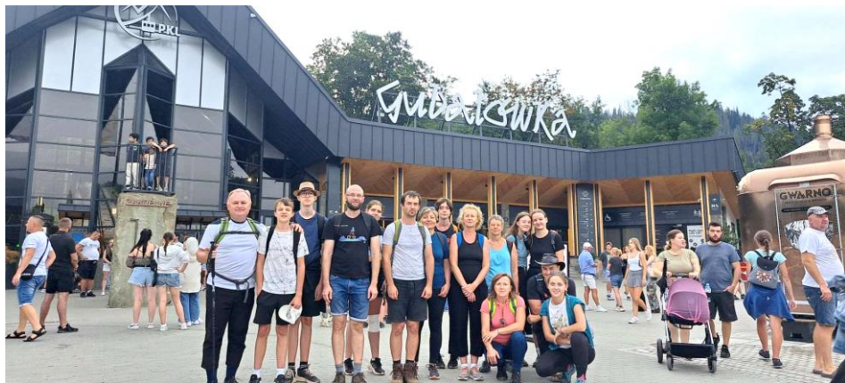
Foto 13. Stanice lanovky Gubalówka

Tento den byl zaslouženě odpočinkový, ale ne zas tak moc. Ráno po slavnostní mši svaté a po snídani jsme vyjeli autobusem na stanoviště lanovky Gubalówka 1120 m.n.m nad městem Zakopané, kde jsou krásné výhledy na všechny vrcholky Vysokých Tater z polské strany.