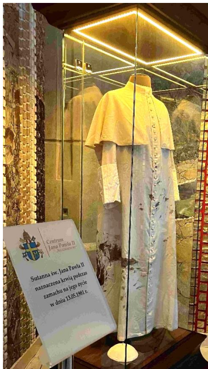
Foto 5. Sutana sv. Jana Pavla II.