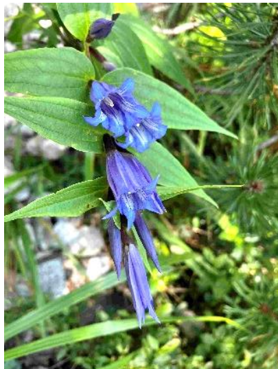
Foto 10. Mořské oko a Hořec

Asi tak po dalších dvou hodinách výstupu se nám otevřel fascinující pohled z výšky na Dolinu pěti jezer, tam dole na břehu prvního jezera byla chata a náš další cíl. Téměř neuvěřitelné, že bychom měli sestoupit po těch tenkých bílých cestičkách.